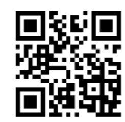
CONSULTA AQUI O PROGRAMA ELEITORAL MUNICIPAL DA CDU