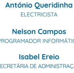
António Queridinha ELECTRICISTA